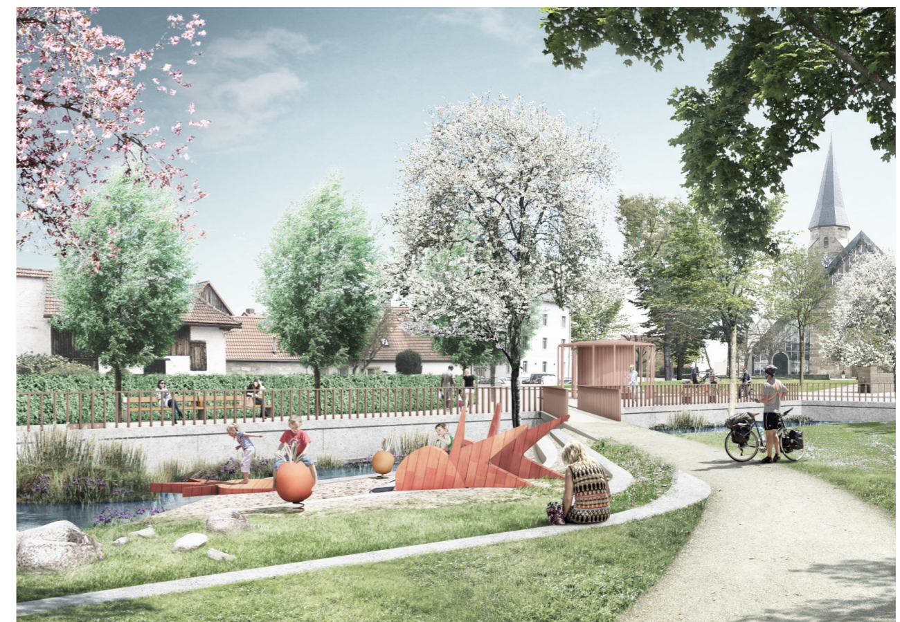
Visualisierung der zukünftigen „Grünen Mitte“