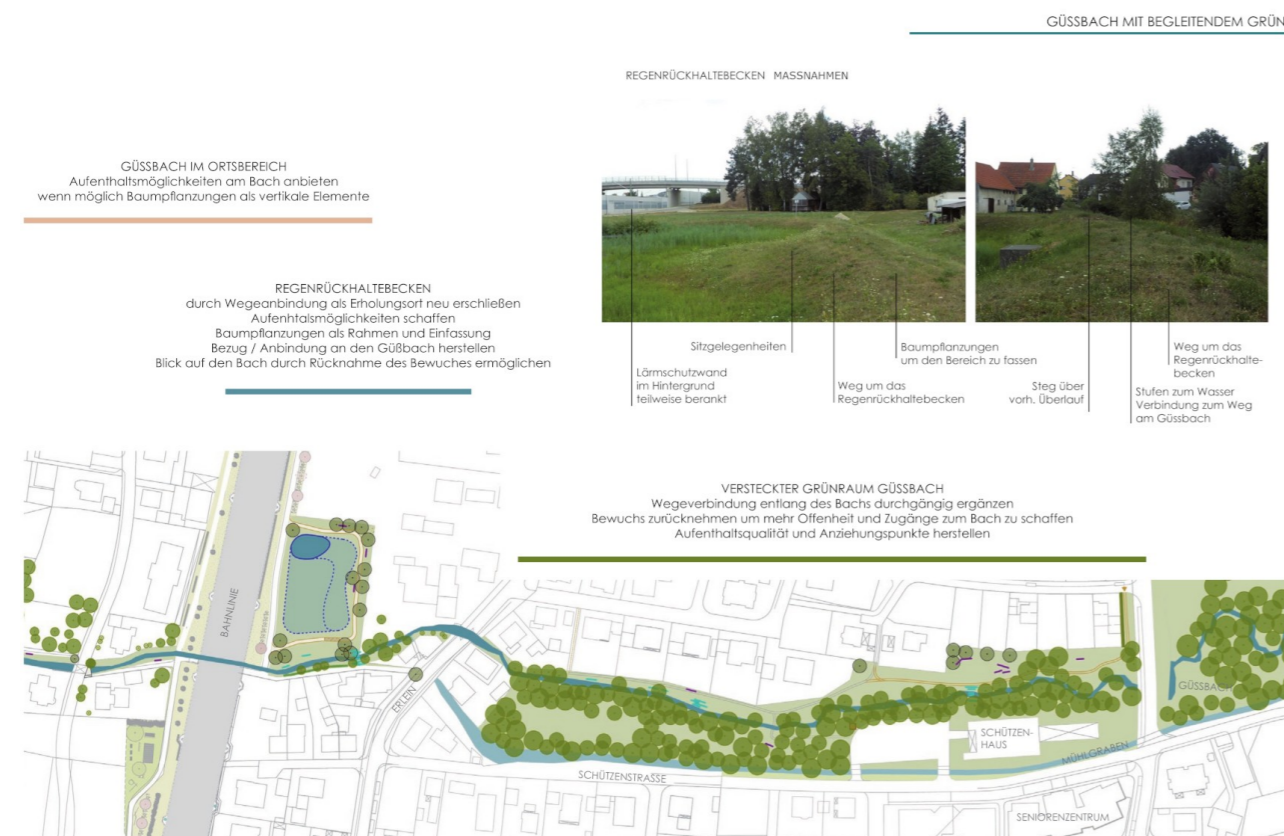
Handlungsraum „Güßbach“ mit Maßnahmen, Ausschnitt Masterplan