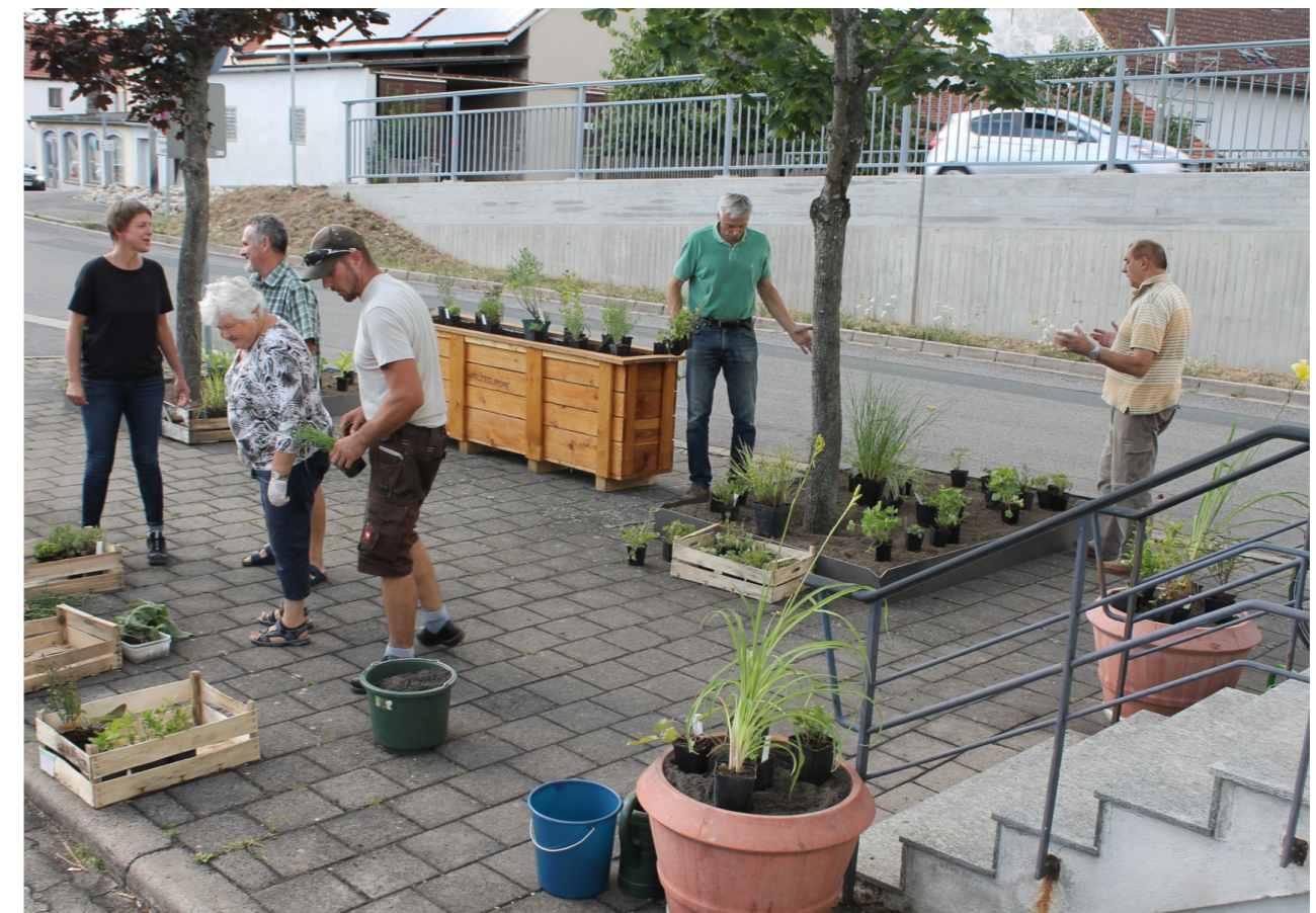
Pflanzaktion der AG am Bürgerhaus