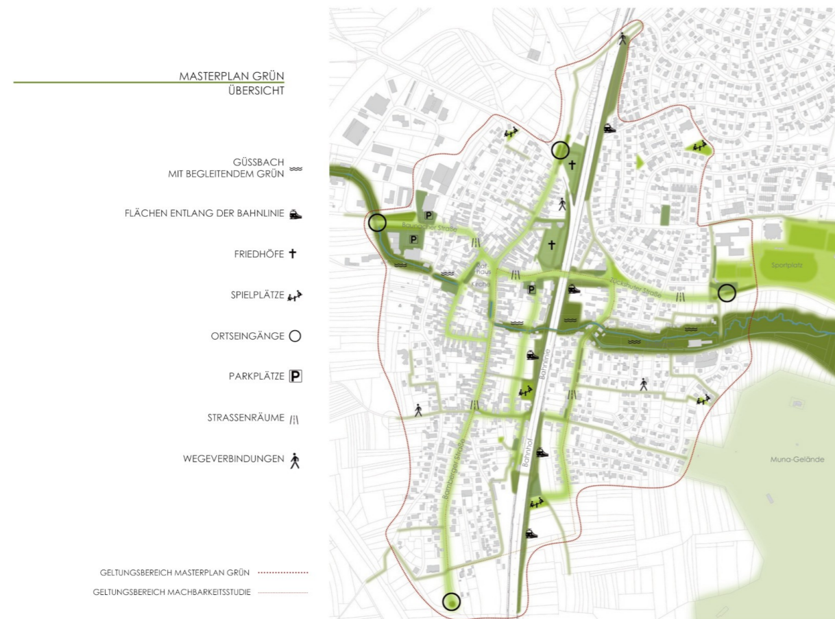
Übersicht der Handlungsräume, Ausschnitt Masterplan