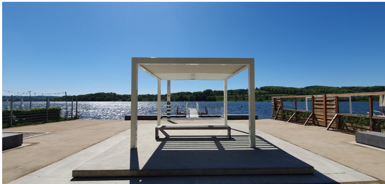
E.NWzW-Weiße Flotte Baldeneysee-Anleger Strandbad