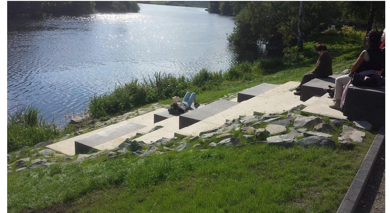
E.NWzW-Sitzstufenanlage Ruhrufer Essen Steele