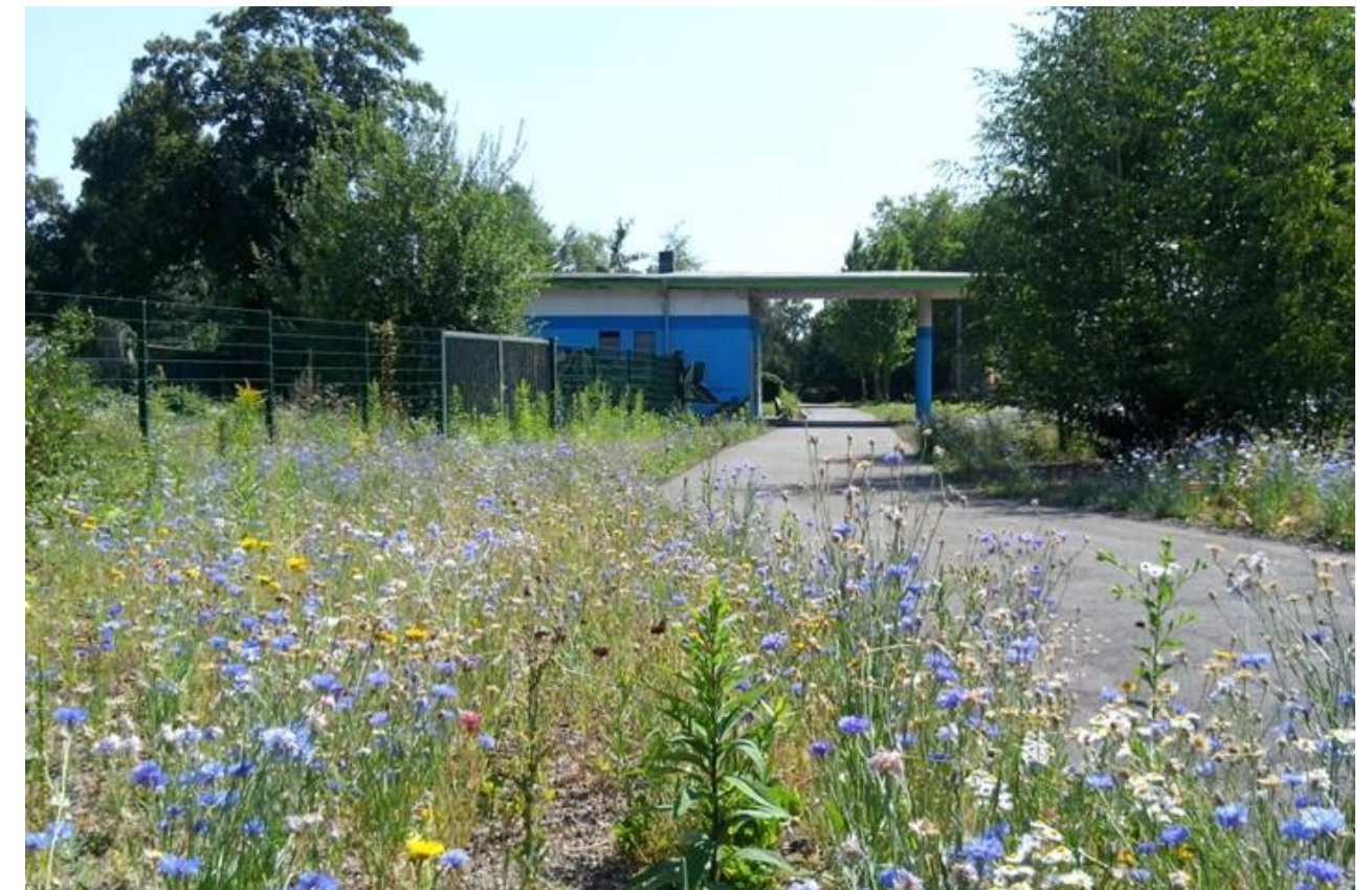
E.NWzW-Wildwiesenmeer Magistrale Vogelheim