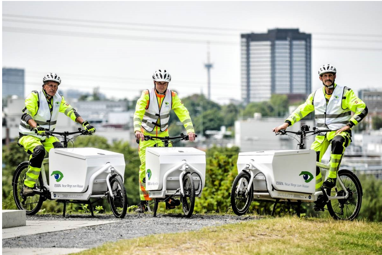
E.NWzW-Neue Lastenräder für die Radwegewartung