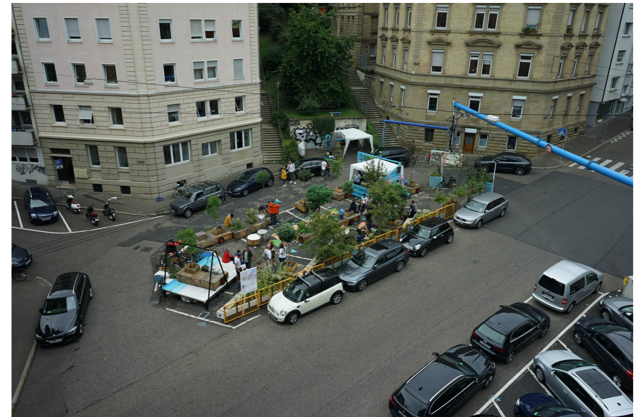
Grüne Oase am CASA Schützenplatz