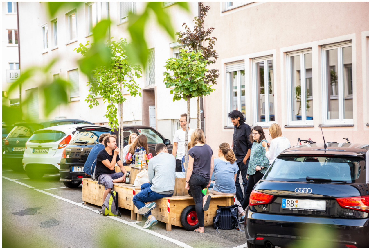
Nachbarschaftlicher Feierabend unter Bäumen