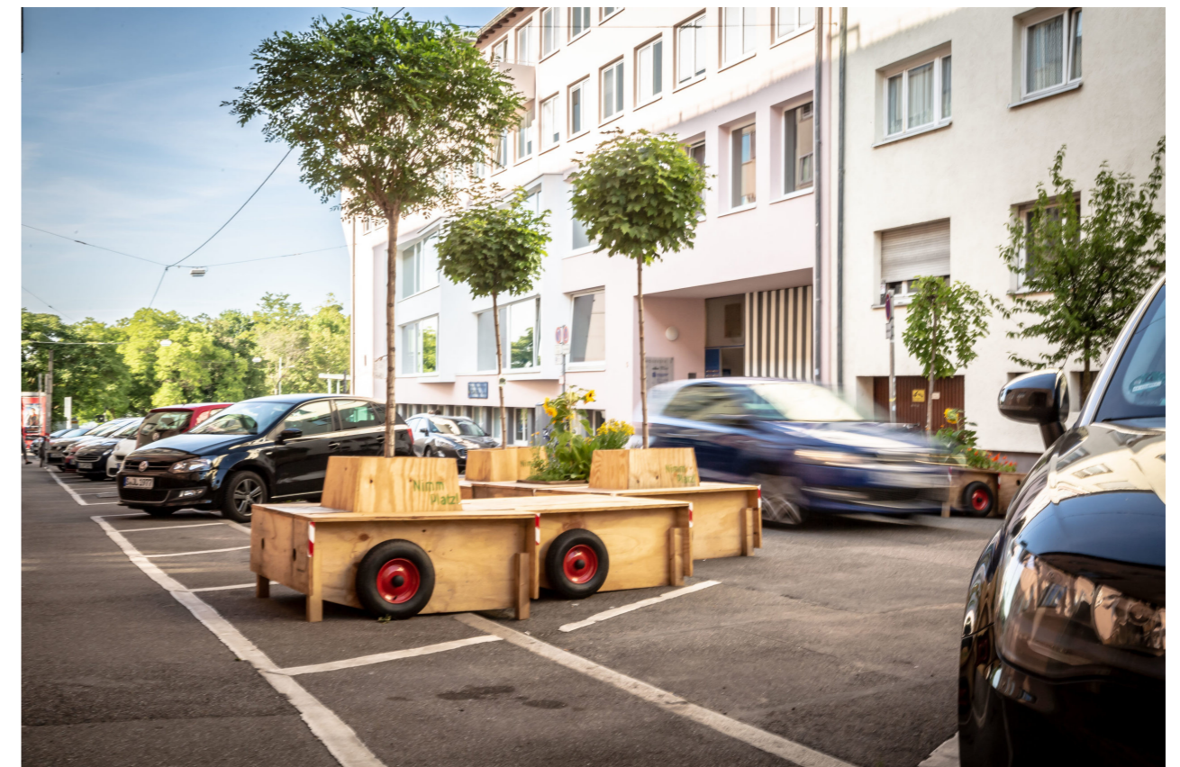
Bäume & Aufenthaltsangebote statt Parkplätze