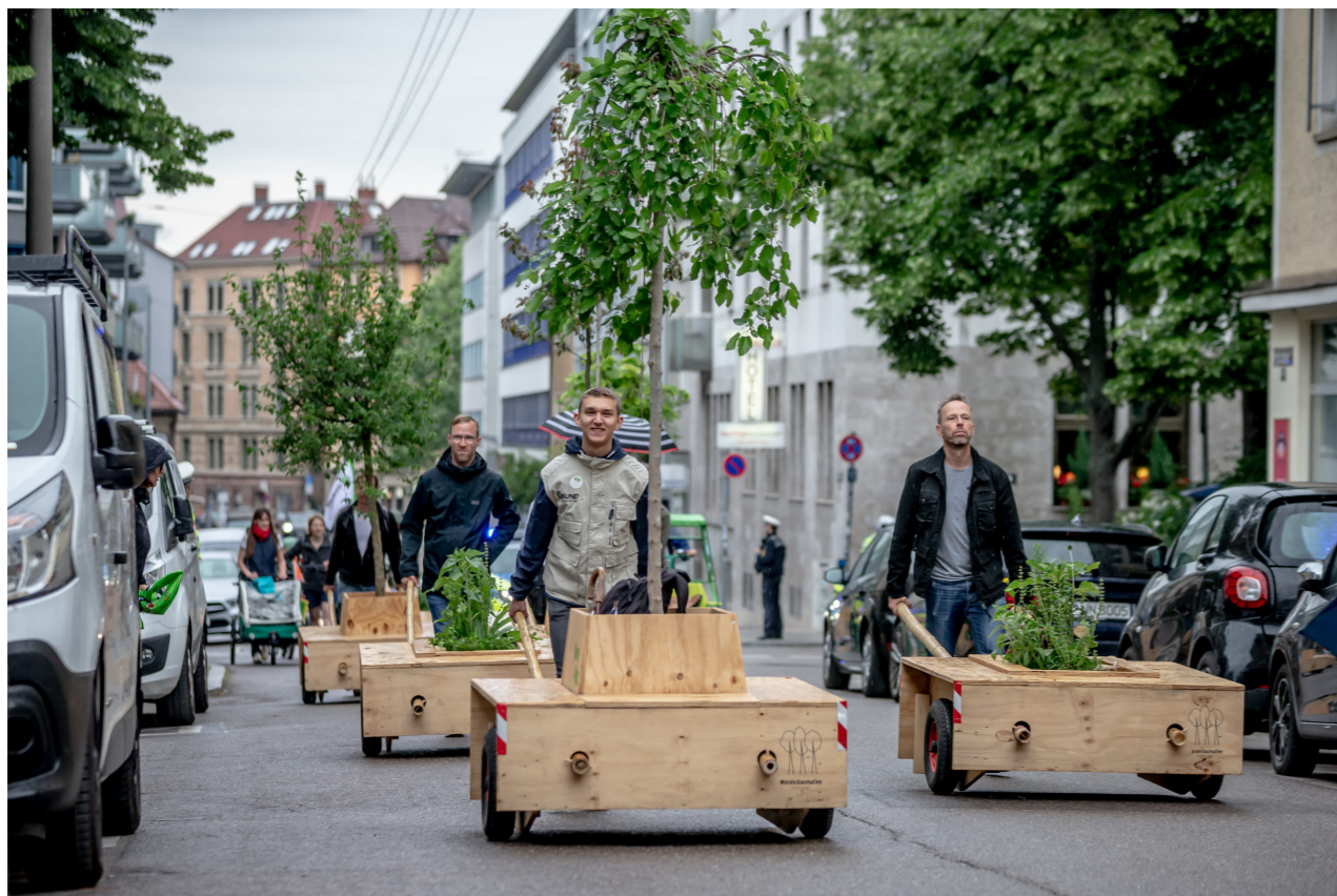
Stadtgespräch: Baumwanderung zur neuen Station